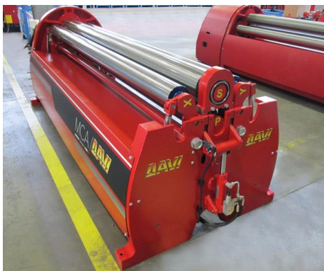
Krivilni stroj na 4 valje – MCA 2500 mm x 6 mm