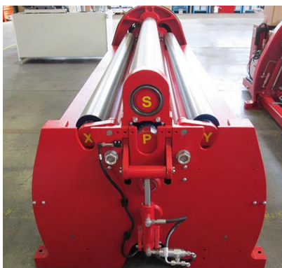
Krivilni stroj na 4 valje – MCA 3000 mm x 6 mm