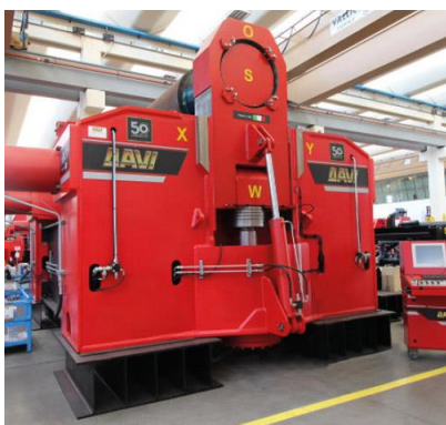
Krivilni stroj na 3 valje – MAV 3000 mm x 190 mm