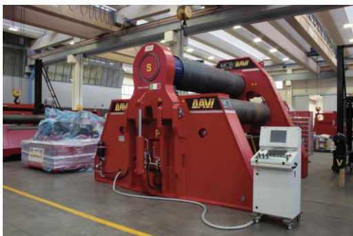
Krivilni stroj na 4 valje – MCB 3000 mm x 96 mm