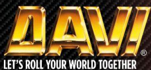
PLATE ROLL AND ANGLE ROLL

STROJI, KI SO TRENUTNO NA VOLJO STROJI ZA VALJANJE PLOČEVINRE DEBELINE OD 6 DO 300 MM. STROJI ZA UPOGIBANJE NOSILCEV, CEVI, PRIROBNIC IN NAJŠIRŠI NABOR PROFILOV.