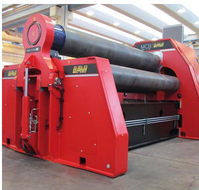
Krivilni stroj na 4 valje – MCB 3000 mm x 44 mm