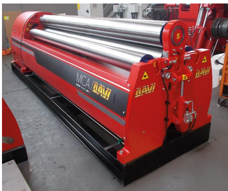
Krivilni stroj na 4 valje – MCA 2000 mm x 16 mm