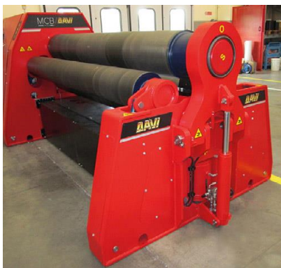
Krivilni stroj na 4 valje – MCB 2000 mm x 26 mm