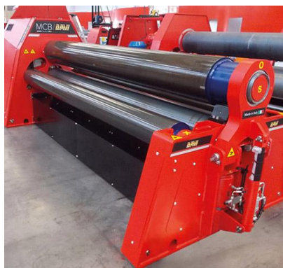
Krivilni stroj na 4 valje – MCB 2500 mm x 24 mm