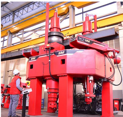
Stroj za krivljenje cevi in profilov na 3 valje – MCP 4300 W cm 3