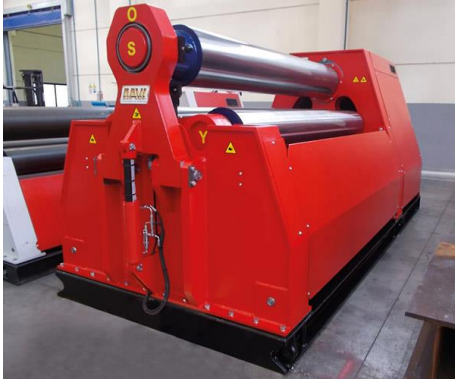
Krivilni stroj na 3 valje – MCO 2500 mm x 10 mm