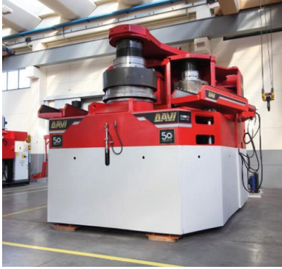
Stroj za krivljenje cevi in profilov na 3 valje – MCP 8000 W cm 3