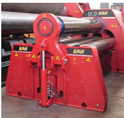
Krivilni stroj na 4 valje – MCB 2500 mm x 30 mm