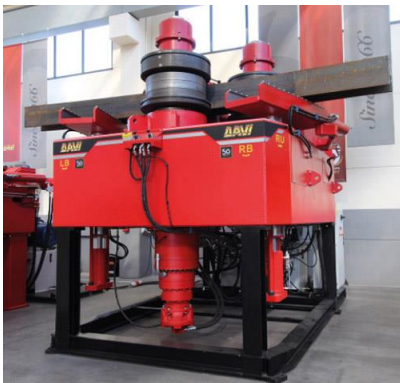
Stroj za krivljenje cevi in profilov na 3 valje – MCP 1700 W cm 3