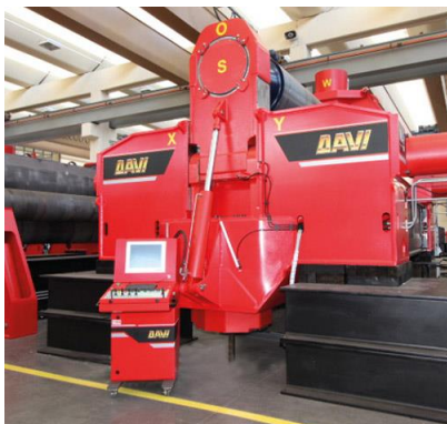
Krivilni stroj na 3 valje – MAV 3000 mm x 160 mm