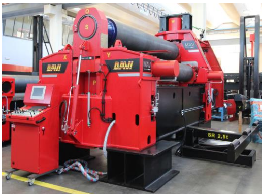
Krivilni stroj na 3 valje – MAV 3000 mm x 68 mm