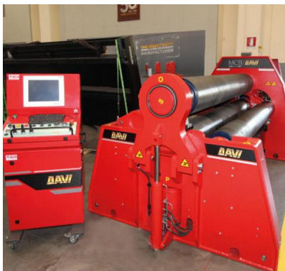
Krivilni stroj na 4 valje – MCB 3000 mm x 28 mm