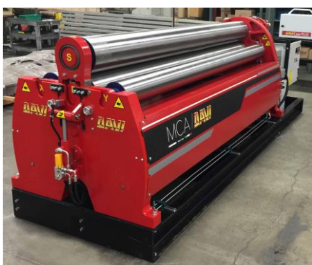
Krivilni stroj na 4 valje – MCA 2500 mm x 8 mm