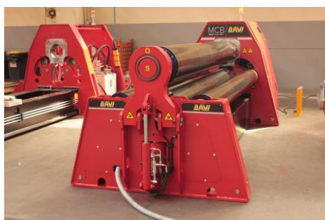
Krivilni stroj na 4 valje – MCB 2000 mm x 22 mm

STROJI, KI SO TRENUTNO NA VOLJO STROJI ZA VALJANJE PLOČEVINRE DEBELINE OD 6 DO 300 MM. STROJI ZA UPOGIBANJE NOSILCEV, CEVI, PRIROBNIC IN NAJŠIRŠI NABOR PROFILOV.