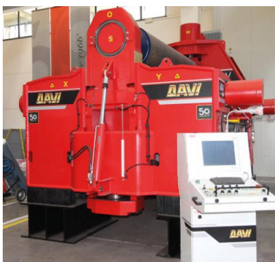
Krivilni stroj na 3 valje – MAV 3000 mm x 85 mm