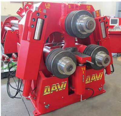
Stroj za krivljenje cevi in profilov na 3 valje – MCP 150 W cm 3