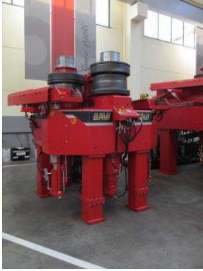
Stroj za krivljenje cevi in profilov na 3 valje – MCP 450 W cm 3