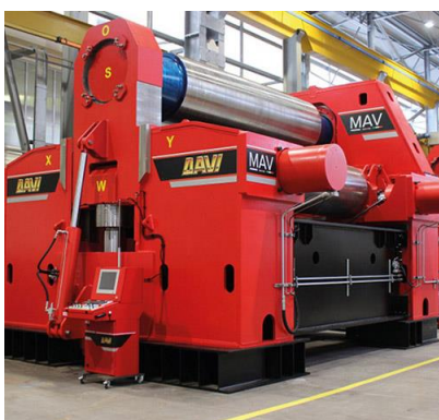
Krivilni stroj na 3 valje – MAV 4200 mm x 195 mm