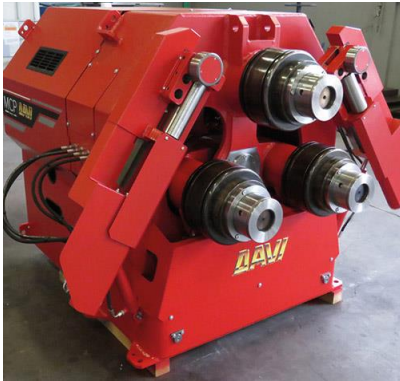
Stroj za krivljenje cevi in profilov na 3 valje – MCP 90 W cm 3