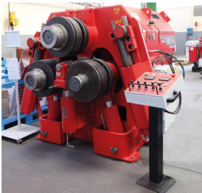
Stroj za krivljenje cevi in profilov na 3 valje – MCP 220 W cm 3