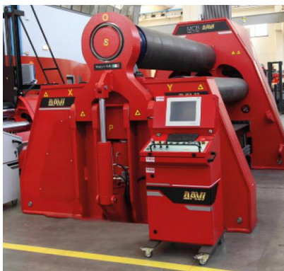
Krivilni stroj na 4 valje – MCB 3000 mm x 60 mm