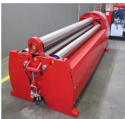
Krivilni stroj na 4 valje – MCA 3000 mm x 9 mm