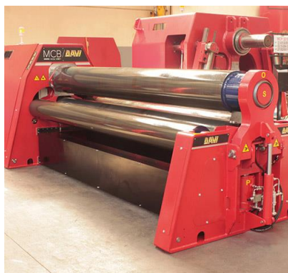
Krivilni stroj na 4 valje – MCB 3000 mm x 22 mm