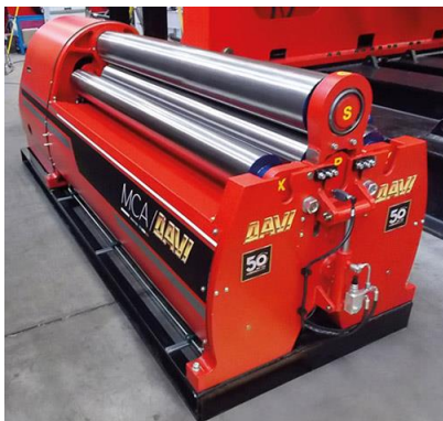
Krivilni stroj na 4 valje – MCA 2000 mm x 11 mm