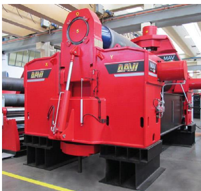
Krivilni stroj na 3 valje – MAV 3000 mm x 110 mm