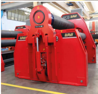
Krivilni stroj na 4 valje – MCB 3000 mm x 82 mm