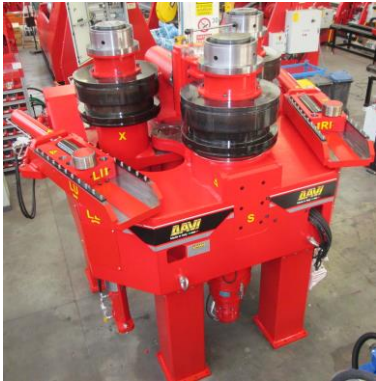
Stroj za krivljenje cevi in profilov na 3 valje – MCP 570 W cm 3