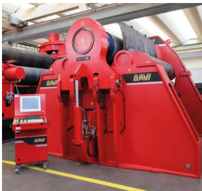
Krivilni stroj na 4 valje – MCB 3000 mm x 85 mm