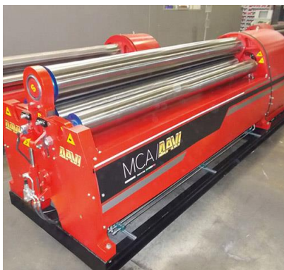
Krivilni stroj na 4 valje – MCA 3000 mm x 14 mm